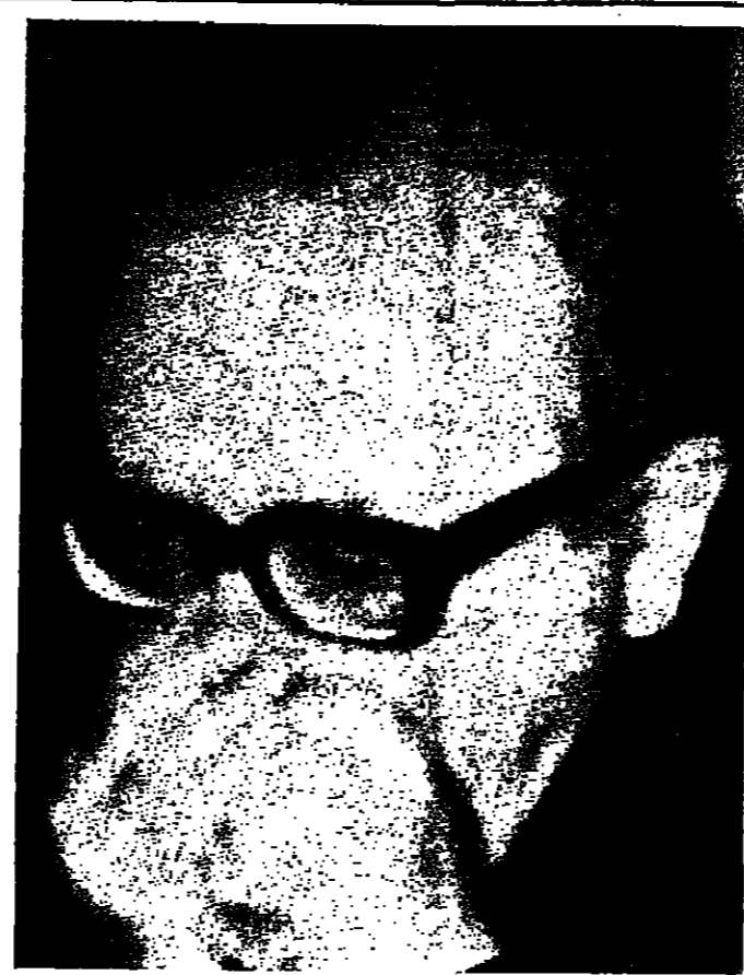
الرئيس صائب سلام

وقال السيد عثمان صالح سبي، رئيس اللجنة الوطنية، ان هذه اللجان تهدف الى تقريب وجهات النظر بين مختلف الفئات.